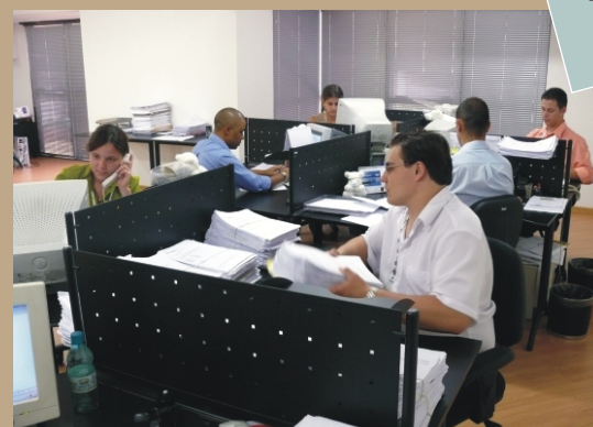
Equipe especializada para o atendimento