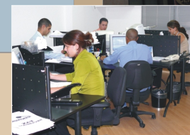
Na Centauro o atendimento é rápido e eficiente

Ainda segundo ele, esse é um sistema moderno, avançado e seguro, que foi desenvolvido para facilitar a vida do corretor e dos beneficiários