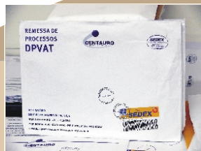
Documento via sedex de graça

O Sistema Facilitador de Remessa de Processos da Centauro na área de DPVAT começou a ser desenvolvido no segundo semestre de 2004. Numa iniciativa inédita a empresa mandou um convite para os corretores e aqueles que aceitavam e se cadastravam no sistema recebiam envelopes identificados para o envio de documentos via sedex e na seqüência uma carteirinha dos correios para despachar os documentos sem custo algum. Em pouco tempo as carteirinhas foram substituídas por uma autorização de postagem que pode ser retirada via internet, mediante senha que o corretor recebe, e que é aceita em todas as agências dos Correios do País.